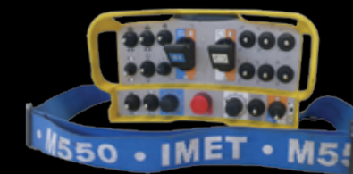
Radiocomando Radio remote control panel