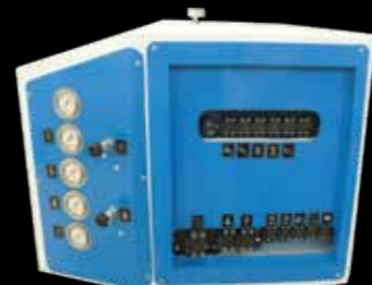
Comandi Proporzionali Proportional Controls