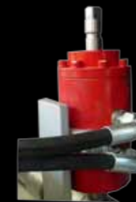
Attuatore apertura aria Proportional Air Valve