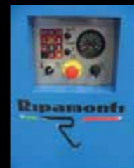
Quadro elettrico Electric panel