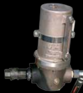
Lubrificatore di linea Line lubricator